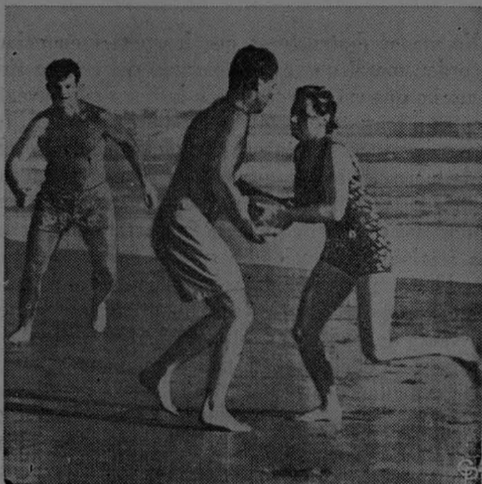
JUGANDO AL FUTBOL. — La señora Edward Kennedy le pasa la bola de fútbol a su cuñado, Robert Kennedy, mientras su esposo viene hacia ellos para bloquear el tiro, en Acapulco, México. Robert no hizo comentarios acerca de los informes de que quizá sea nombrado Procurador General en el Gabinete de su hermano.

He aquí dos ejemplos tomados ambos de Juan de Valdés en "El Diálogo de la Lengua": "Los mismos que dicen eso, os PROMETO se aprovechan muchas veces de esa que llaman cosa inútil". "Yo os PROMETO, si no fuese cosa contraria a mi profesión, que me habría, algunos días ha, determinadamente puesto en hacer un libro en la lengua castellana, como uno que diz que Erasmo ha hecho en la latina..."